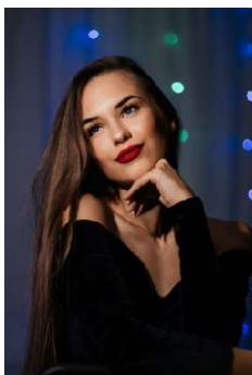
ЯКИМОВА ЮЛИЯ РОМАНОВНА -ВОКАЛИСТ, ЛАУРЕАТ МЕЖДУНАРОДНЫХКОНКУРСОВ, РОССИЯ