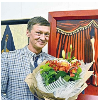
ОЛЕГ ВАЛЕНТИНОВИЧ ИГНАТОВ г. РОСТОВ -НА - ДОНУ , ЖИВОПИСЕЦ, ЗАСЛУЖЕННЫЙ ХУДОЖНИК РОССИИ, ОБЛАДАТЕЛЬ НАГРАД РОССИЙСКОЙ АКАДЕМИИ ХУДОЖЕСТВ, ПРОФЕССОР КАФЕДРЫ ЖИВОПИСИ, ГРАФИКИ И СКУЛЬПТУРЫ ЮФУ,ПРЕДСЕДАТЕЛЬ ПРАВЛЕНИЯ РОСТОВСКОГО ОТДЕЛЕНИЯ ВТ ОО «СОЮЗ ХУДОЖНИКОВ РОССИИ».