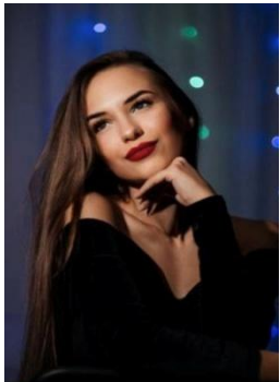
ЯКИМОВА ЮЛИЯ РОМАНОВНА -ВОКАЛИСТ, ЛАУРЕАТ МЕЖДУНАРОДНЫХКОНКУРСОВ, РОССИЯ